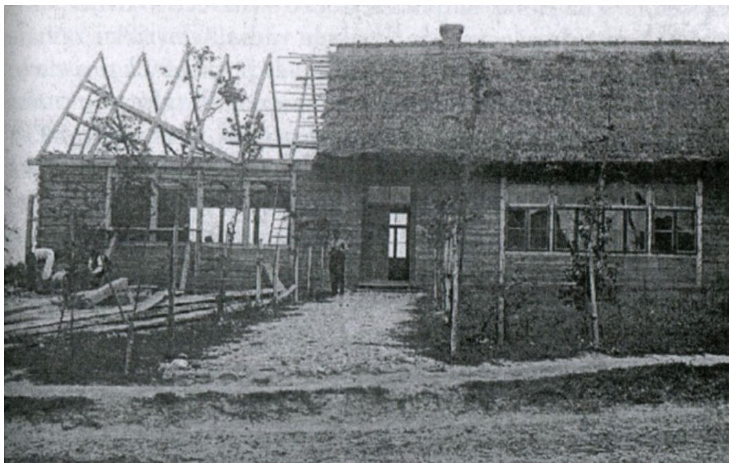
Budowa szkoły w Woli Osowińskiej w 1935 roku