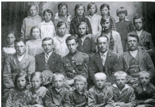
Grupa uczniów i grono pedagogiczne ze szkoły w Tchórzewie, lata 30. XX wieku