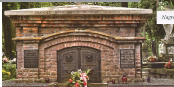
Mogila powstańców styczniowych