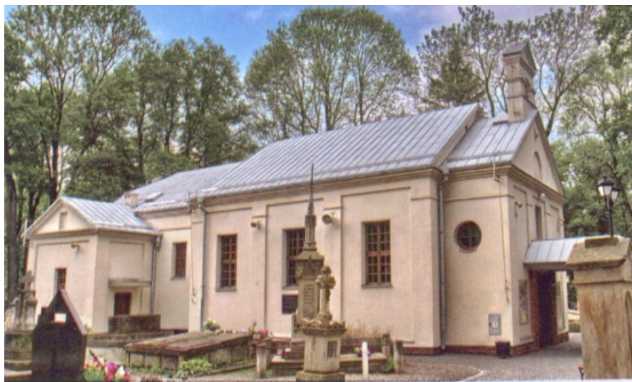
Kościół rektoralny pw. Wszystkich Świętych

Zapraszamy Państwa do spaceru alejami lubelskiej nekropoli zaczynając od bramy głównej przy ul. Lipowej przez część rzymskokatolicką, prawosławną, ewangelicką, a na wojskowo-komunalnej od ul. Białej kończąc. Życzymy miłego i spokojnego czasu w myśl łacińskiej maksymy NON OMNIS MORIAR - nie cały umrę.