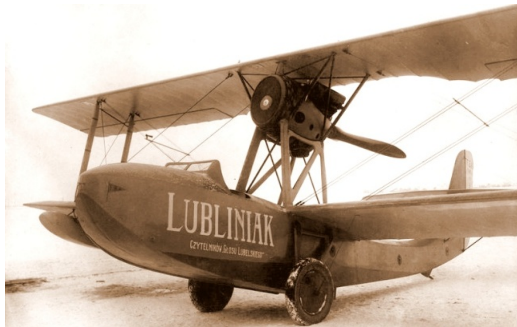
1926 - 015 - Schreck FBA-17HMT2 amfibia franc. produkowana w Lublinie-1925 - użytkowana do 1937