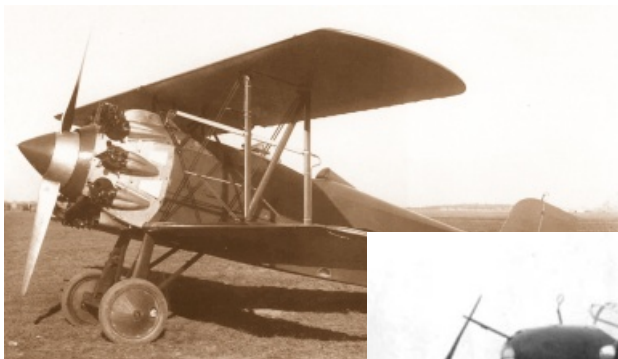
1929 - 022 - PWS-A samolot myśliwski [licenc. Avia BH.33 E] produkowany w Białej Podlaskiej