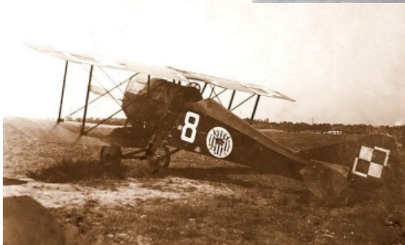
1920 - 005a - Ansaldo A-1 Balilla produkowany w Lublinie włoski samolot myśliwski, oznakowanie eskadry kościuszkowskiej - 1920-27