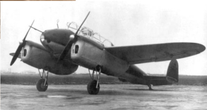
1938 - 051 - PWS-33-1 Wyżel - prototyp samolotu szkoleniowo-treninowego