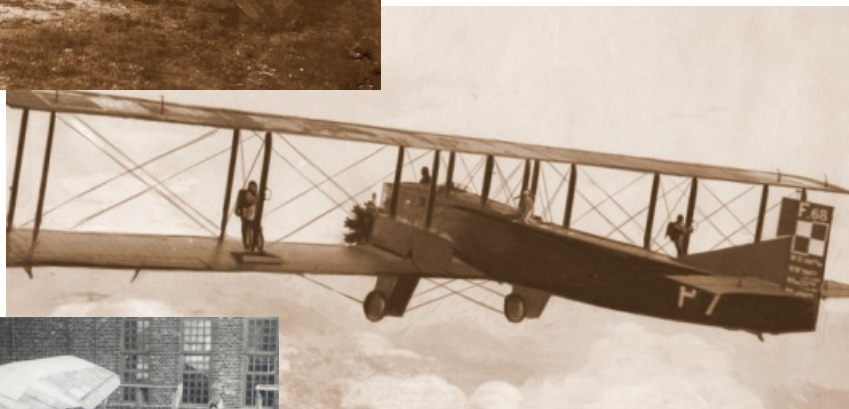
1926 - 013 - Farman F-68 Goliath ze skoczkami na skrzydłach nad Krakowem - 1927