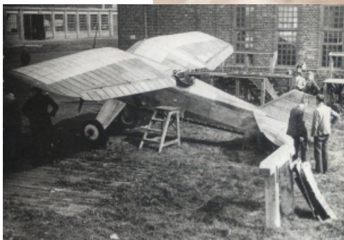
1930 - 030 - PZL P-1 metalowy samolot myśliwski - zmontowany prototyp