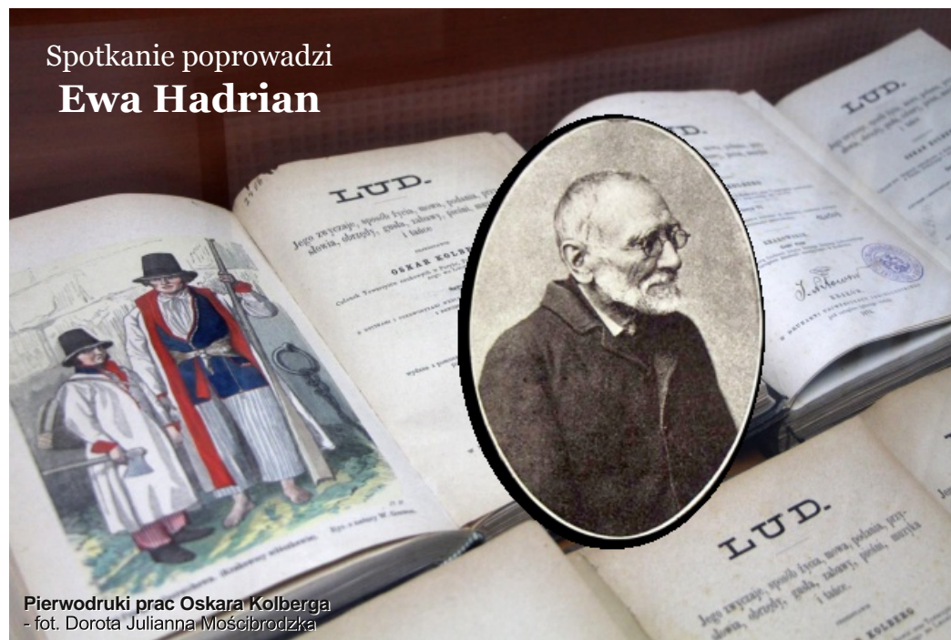
Pierwodruki prac Oskara Kolberga