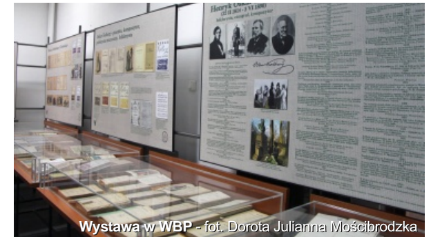
Wystawa w WBP

Wystawa ma charakter edukacyjny, przybliży odbiorcom życie i dzieło Oskara Kolberga. Wyeksponowano przede wszystkim Kolberga jako etnografa i folklorystę, a także muzyka i kompozytora (rodzina Kolbergów utrzymywała bliskie związki z rodziną Chopina i samym Fryderykiem Chopinem), współpracownika wielu pism, autora kilkuset haseł do Encyklopedii powszechnej Samuela Orgelbranda.