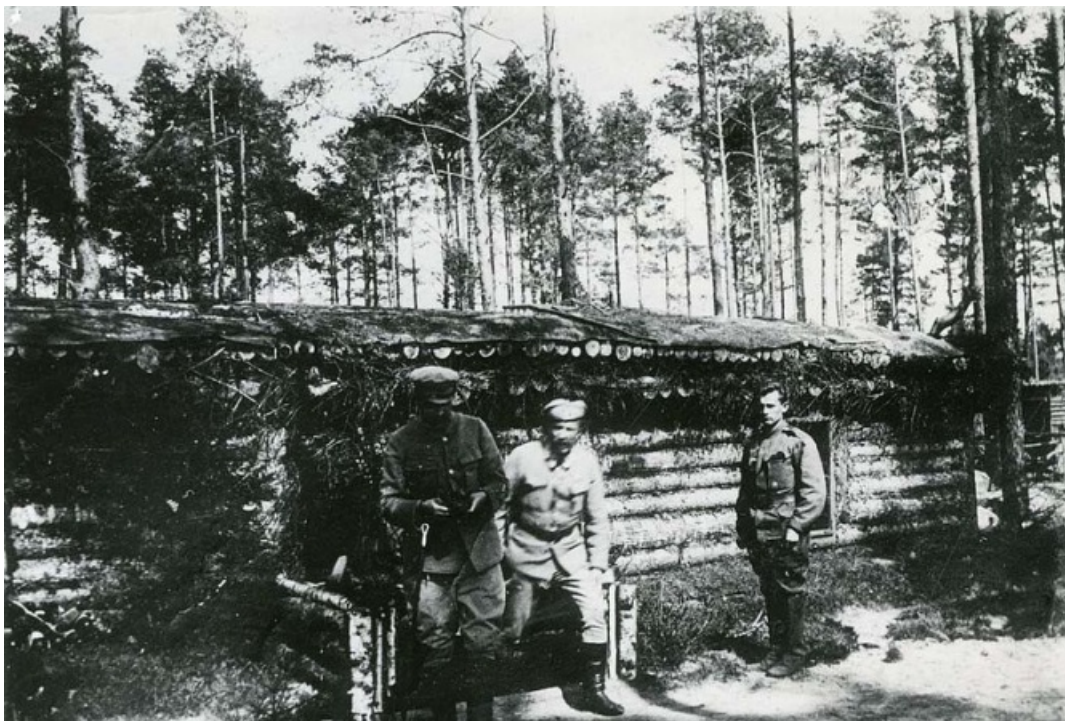
Józef Piłsudski wychodzi z ziemianki płk. Leona Berbeckiego. Pozycje pod Kostiuchnowką.