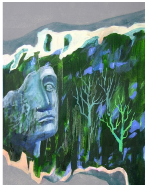
Epitafium dla IM, 90 x 90 cm, olej na płótnie, 2015

Doskonali swój warsztat na studiach podyplomowych w Krakowskiej Akademii Sztuk Pięknych im. Jana Matejki.