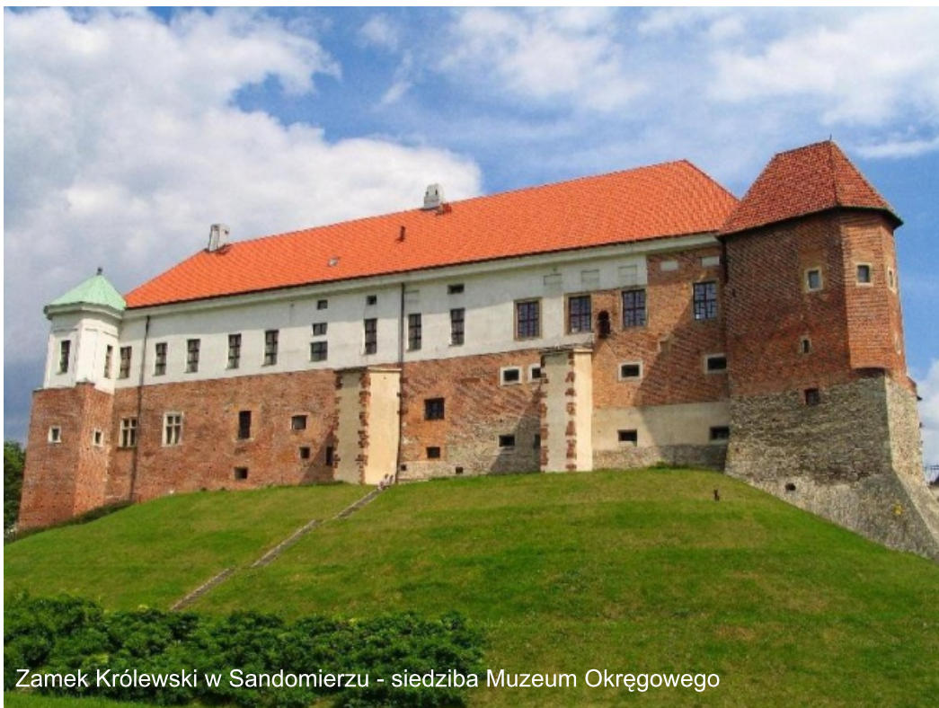
Zamek Królewski w Sandomierzu - siedziba Muzeum Okręgowego

Książka Pamięć murów. Szkice z historii Sandomierza XII i XIII wieku jest wędrówką po Sandomierzu wczesnośredniowiecznym. Na tle miasta dalekiej historycznie pamięci ukazane zostały losy niezwykłych, związanych z nim postaci. To one nadawały treść miejscom i budowlom, kształtując lokalną, a często i krajową rzeczywistość. Zatem tytułowa pamięć murów to opowieść o ludziach wypełniających je swoimi emocjami i działaniem w burzliwych czasach dzielnicowego rozbitcia i tatarskich najazdów. Autorka odwołuje się do związanych z bohaterami wizji malarskich, literackich i hagiograficznych, wplatając swoją narrację w wątek łańcucha dziejowej ciągłości, dającej nadzieję trwania, wbrew destrukcyjnej sile czasu i zła.