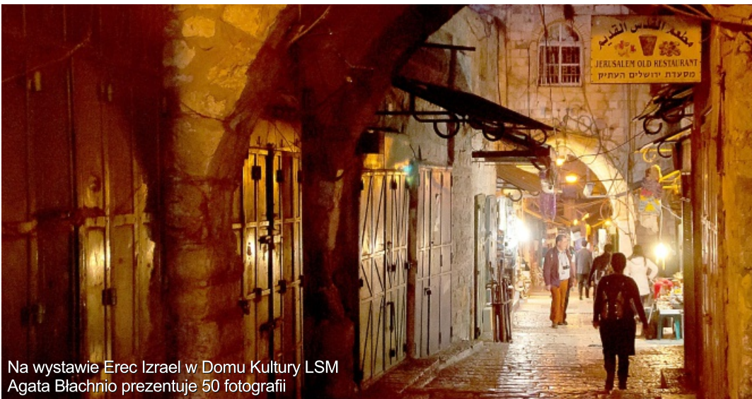
Na wystawie Erec Izrael w Domu Kultury LSM Agata Błachnio prezentuje 50 fotografii

200 lat spółdzielczości na ziemiach polskich