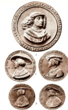
MEDALE WĘGIERSKICH JAGIELLONÓW