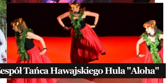
Zespół Tańca Hawajskiego Hula "Aloha"

Koncert odbędzie się w piątek 12 października 2018 r. o godz. 20.00 w sali widowiskowej Domu Kultury LSM w Lublinie, ul. K. Wallenroda 4a, tel. 81 743 48 29, www.domkulturyism.pl