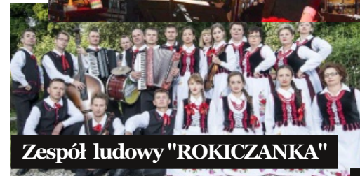
Zespół ludowy "ROKICZANKA"