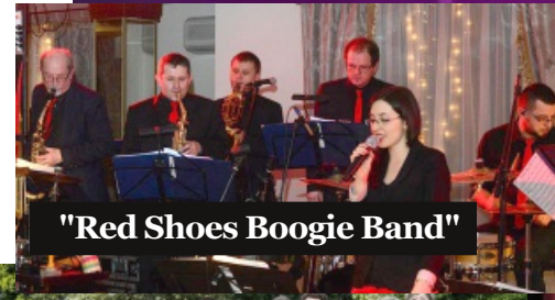
"Red Shoes Boogie Band"