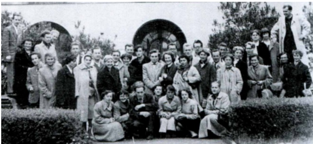
Zbiorowe zdjęcie historyków sztuki. Rocznik 1951/1952 na dziedzińcu KUL. Rok 1953.

Józef Zięba, Dlaczego nie zlikwidowano Katolickiego Uniwersytetu Lubelskiego w okresie PRL? , s. 7-9, Wydawnictwo POLIHYMNIA, Lublin 2018