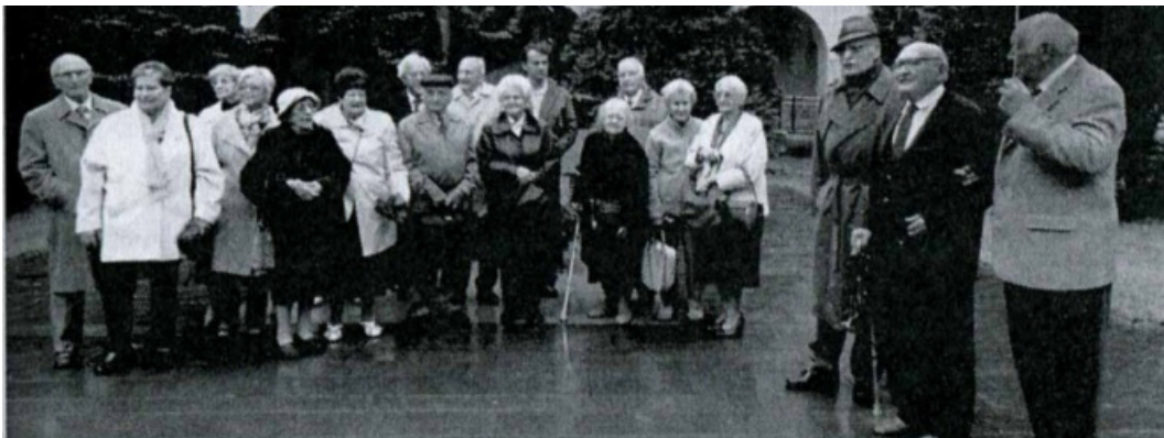
Spotkanie koleżeńskie polonistów po sześćdziesięciu sześciu latach od rozpoczęcia studiów (rocznik 1951/1955) 17 września 2017 r.