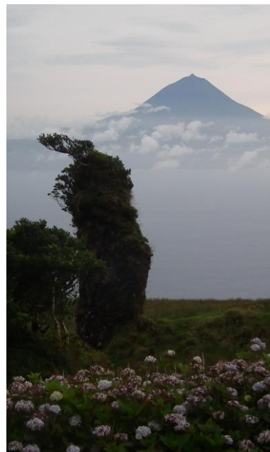
Azory, widok na Pico

Co roku organizujemy także rajdy rowerowe, w tym początkowo na Ukrainę, następnie wieloetapowy rajd wokół Polski i wzdłuż Wisły, a obecnie rajd wzdłuż Dunaju. MKT jest również inicjatorem wycieczek dla pacjentów z chorobami układu oddechowego (wyjazdy autokarowe w nieznane regiony Polski, na Ukrainę, Węgry, Białoruś i do Obwodu Kaliningradzkiego). W 2013 roku byliśmy inicjatorami reaktywacji Klubu Wysokogórskiego Lublin. Fotografie i artykuły członków MKT były prezentowane na licznych wystawach fotograficznych, w tym w Muzeum Lubelskim na Zamku i na XX Festiwalu Filmów Górskich im. Andrzeja Zawady w Łądku Zdroju oraz w czasopiśmie takich jak Magazyn Turystyki Górskiej „N.P.M” i The Himalayan Journal .