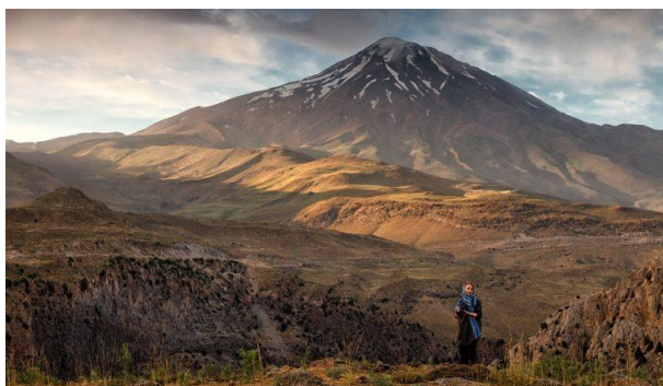
Damavand, Iran