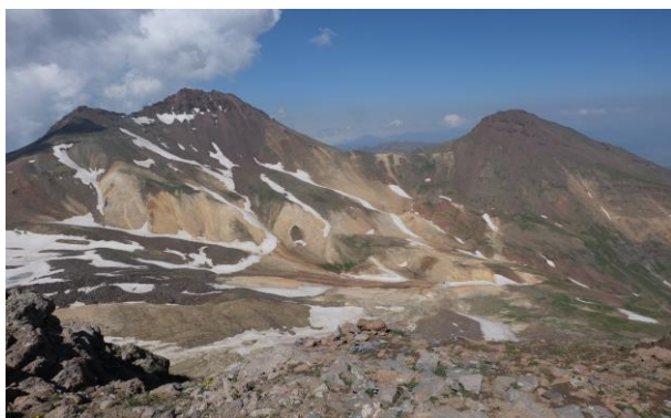
Aragac, Armenia