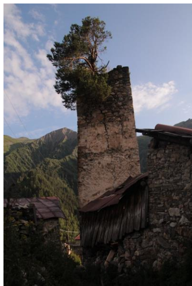
Adishi, Swanetia, Gruzja

Medyczny Klub Turystyczny w Lublinie powstał w 2004 r. Zrzesza osoby związane zawodowo lub prywatnie ze środowiskiem medycznym Lublina. Na początku swojej działalności zorganizowaliśmy kilka wypraw w góry wysokie, w tym między innymi w roku 2006 w Andy Argentyńskie na najwyższy szczyt obu Ameryk – Aconcagua (6962 m n.p.m.) oraz w roku 2008 w indyjskie Himalaje Lahul na szczyt CB13A (6240 m n.p.m.) śladami pierwszej powojennej i jedynej lubelskiej wyprawy w Himalaje z roku 1973. Ponadto z sukcesem wspinaliśmy się na Ararat (5137 m n.p.m.) – najwyższy szczyt Turcji, Kazbek (5033 m n.p.m.) w Kaukazie gruzińskim oraz Damavend (5610 m n.p.m.) najwyższy wulkan Azji i najwyższy szczyt Iranu.