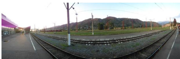
Kolej Erewań-Batumi, Armenia