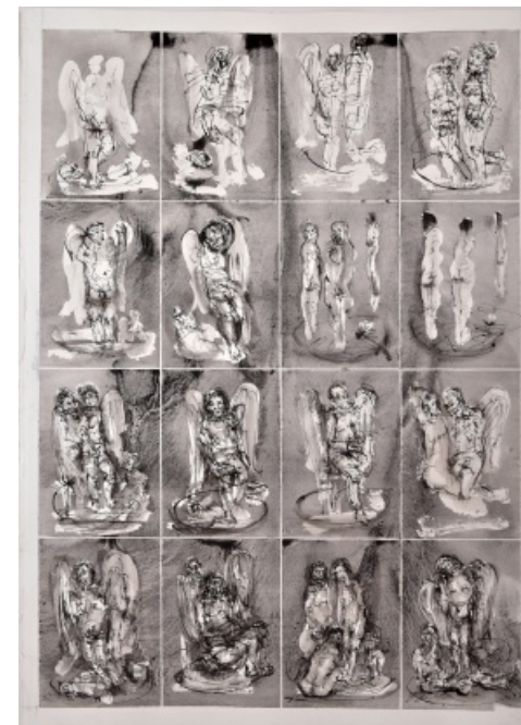
Zbigniew Woźniak - Anioły pomocniczeki białe - tusz, 70 x 50, 2018 r.

Wernisaż odbędzie się w poniedziałek 1 kwietnia 2019 r. o godz. 17.00 w Galerii Sztuki Domu Kultury LSM w Lublinie, ul. K. Wallenroda 4a, tel. 81 743 48 29 www.domkulturylsm.pl Wstęp wolny