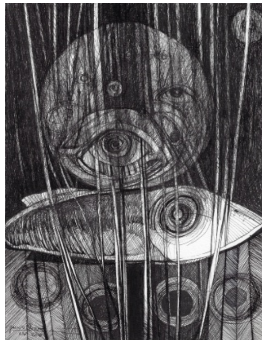
Janusz Skowron - DREAM VIII - tusz, papier akwarelowy, 30 x 23, 2018 r.