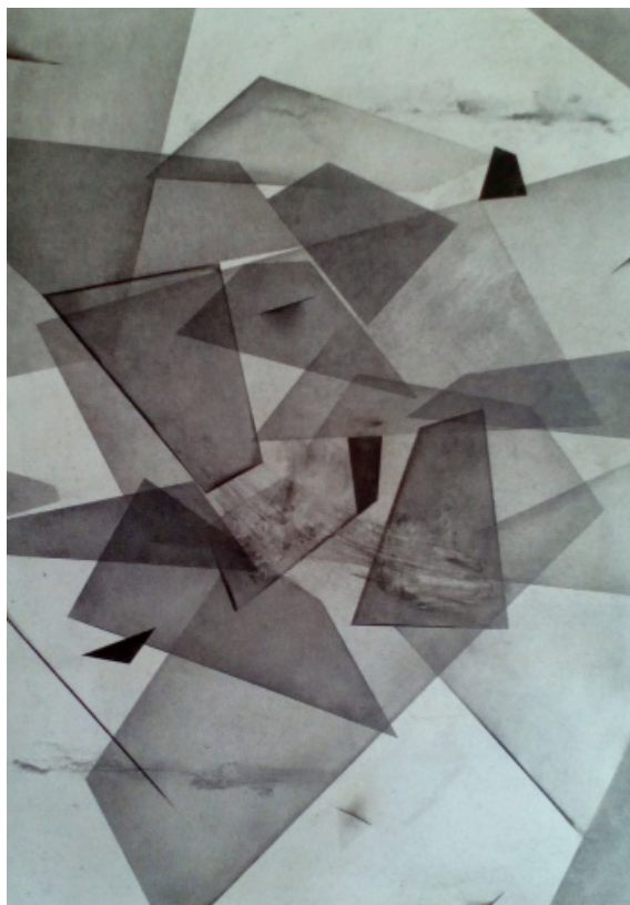
Edyta Piąt - z rekonstrukcji 4 - węgiel, szara tektura, 70 x 50, 2018 r.

W wystawie poza konkursem swoje prace zaprezentowali również członkowie jury.