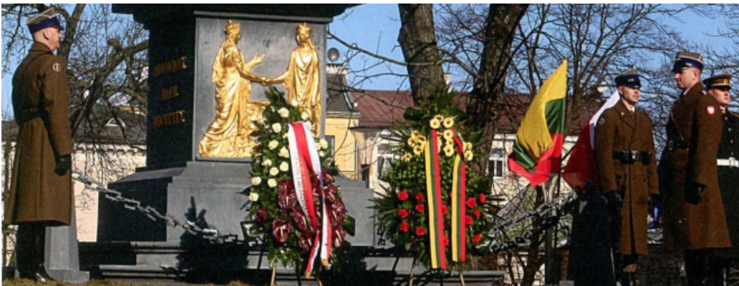
Wieńce przed pomnikiem Unii Lubelskiej - 22 lutego 2019 r.